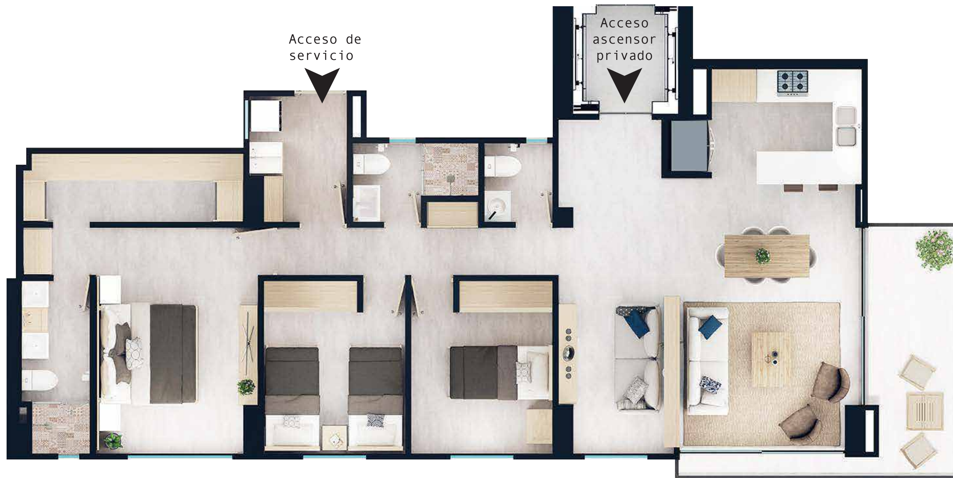
Vista hacia Cali