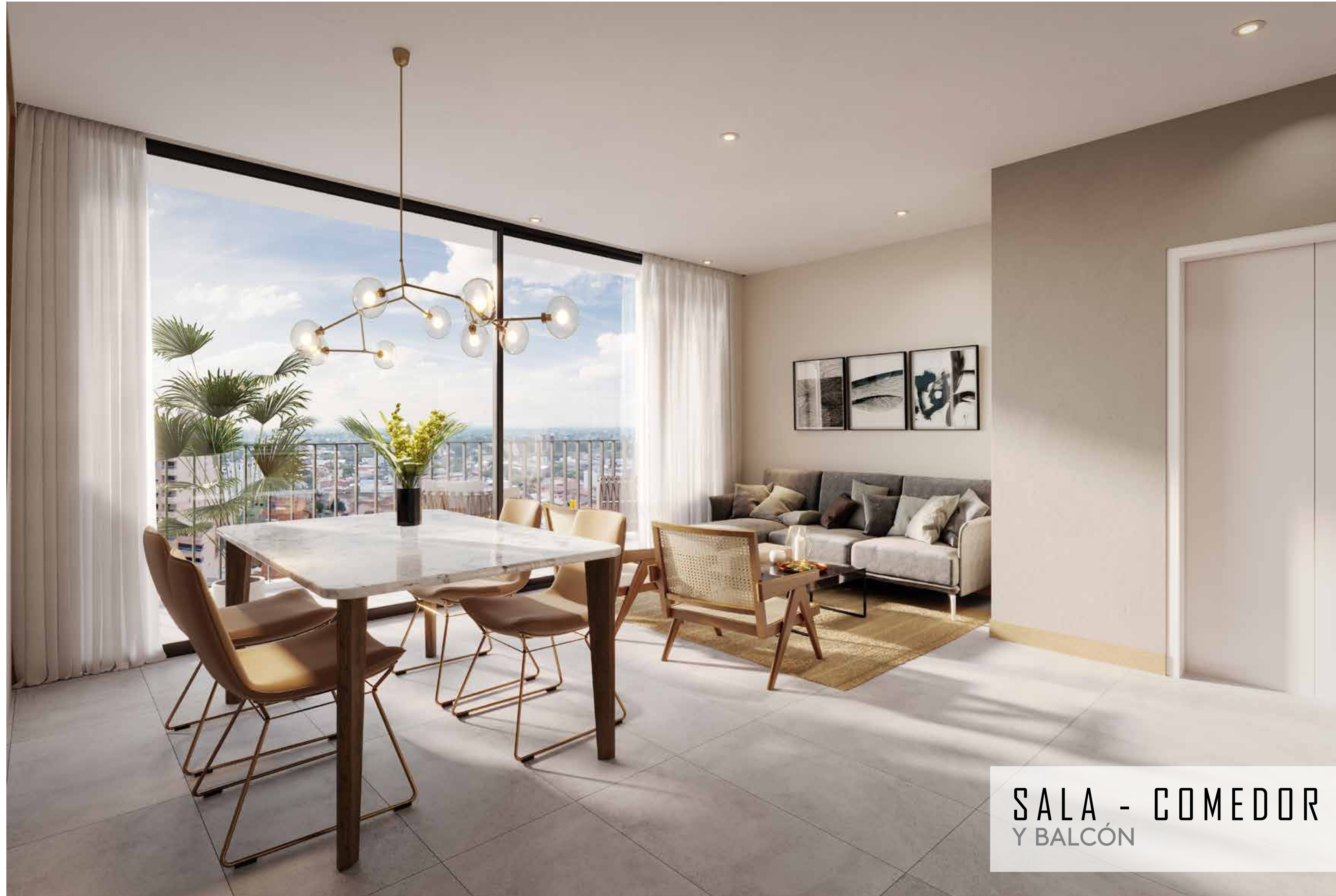
SALA - COMEDOR Y BALCÓN

Rendes del apartamento con áreas construida de 83,1 m 2 . Las imágenes son ilustrativas y corresponden a una interpretación del artista que no comprometen al promotor. Los detalles, color y especificaciones de materiales están sujetos a modificaciones y ajustes durante el proceso de construcción. El mobiliario y la decoración que aparecen en las imágenes se incluyen con fines ilustrativos y no están incluidos dentro de la oferta comercial. Las áreas presentadas son aproximadas. El área del balcón está incluida dentro del áreas construida y privada. Las áreas podrán tener ajustes como consecuencia del proceso de coordinación técnica, o por modificaciones en la licencia de construcción ordenadas por la Curaduría o por la competente.