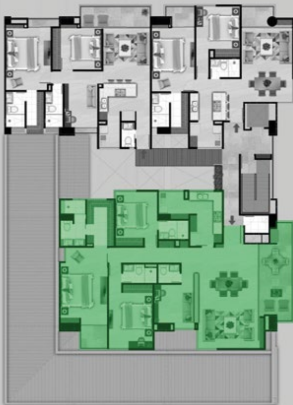
APARTAMENTO TIPO 4 ÁREA CONSTRUIDA: 174,29 M 2